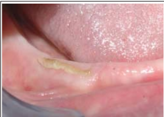
Figure 1 : Petite zone de dénudation osseuse de la crête gingivale inférieure droite par conflit prothétique.

La symptomatologie débute soit par une zone d'exposition osseuse spontanée (figure 1), soit par l'absence de guérison d'une plaie d'extraction. Ces