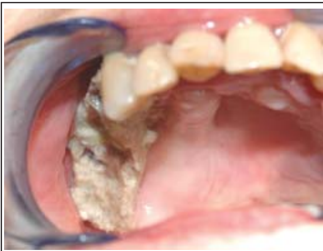
Figure 2 : Large zone d'ostéonécrose maxillaire supérieure droite après extractions dentaires.

lésions peuvent être assez impressionnantes (figure 2). Une surinfection est fréquente et amène la majoration des lésions. Un abcès chronique peut entraîner un inconfort majeur pour le patient. L'individualisation de séquestres, une fistule ou un abcès vers les régions adjacentes ainsi qu'un foyer de fracture sont rencontrés fréquemment. La mandibule est plus souvent affectée que le maxillaire supérieur, vu sa structure corticale et sa vascularisation terminale 3 . La radiographie panoramique n'est pas d'une grande aide dans les stades précoces. Le scanner peut montrer une simple perte de la corticale osseuse (figure 3) ou des délabrements majeurs avec séquestres osseux et/ou