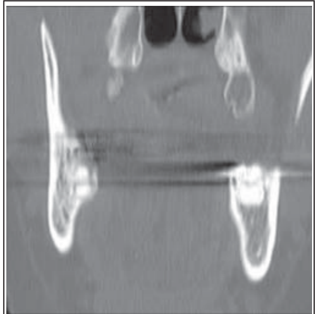
Figure 3 : Tomodensitométrie : petite zone d'ostéolyse de la corticale interne mandibulaire droite.

lésions peuvent être assez impressionnantes (figure 2). Une surinfection est fréquente et amène la majoration des lésions. Un abcès chronique peut entraîner un inconfort majeur pour le patient. L'individualisation de séquestres, une fistule ou un abcès vers les régions adjacentes ainsi qu'un foyer de fracture sont rencontrés fréquemment. La mandibule est plus souvent affectée que le maxillaire supérieur, vu sa structure corticale et sa vascularisation terminale 3 . La radiographie panoramique n'est pas d'une grande aide dans les stades précoces. Le scanner peut montrer une simple perte de la corticale osseuse (figure 3) ou des délabrements majeurs avec séquestres osseux et/ou